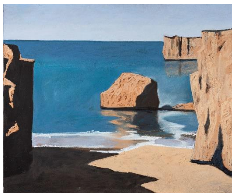
Thomas VERNY Sans titre, 2022 Pastel et acrylique sur panneau, dim. 100 x 120 cm