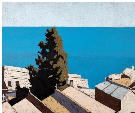
Thomas VERNY Sans titre, 2022 Pastel et acrylique sur panneau, dim. 100 x 120 cm