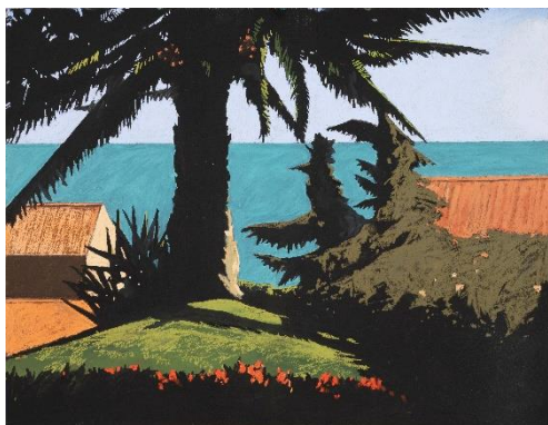
Thomas VERNY Sans titre, 2022 Pastel et acrylique sur panneau, dim. 96 x 121cm